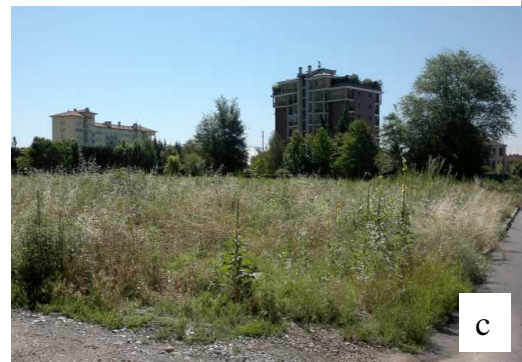
Vista dell'area da via Cascina dei Prati