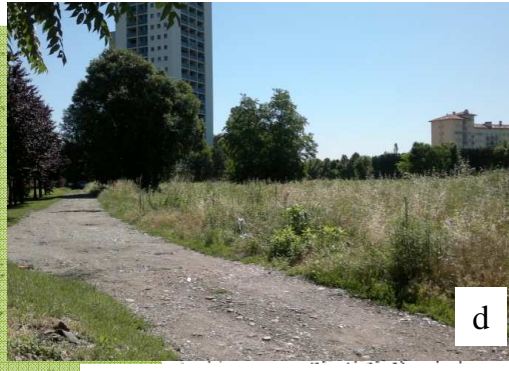
Vista dell'area lato strada sterrata