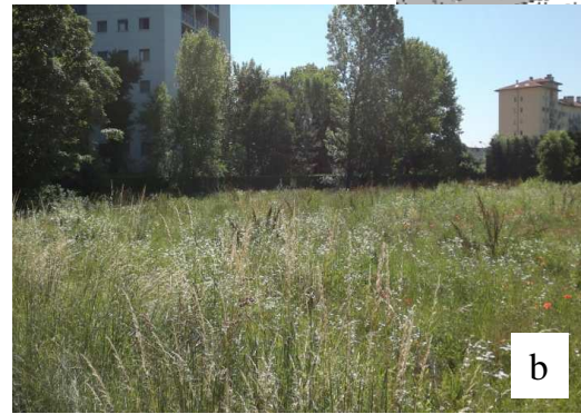
Vista dell'area dal parco lato strada