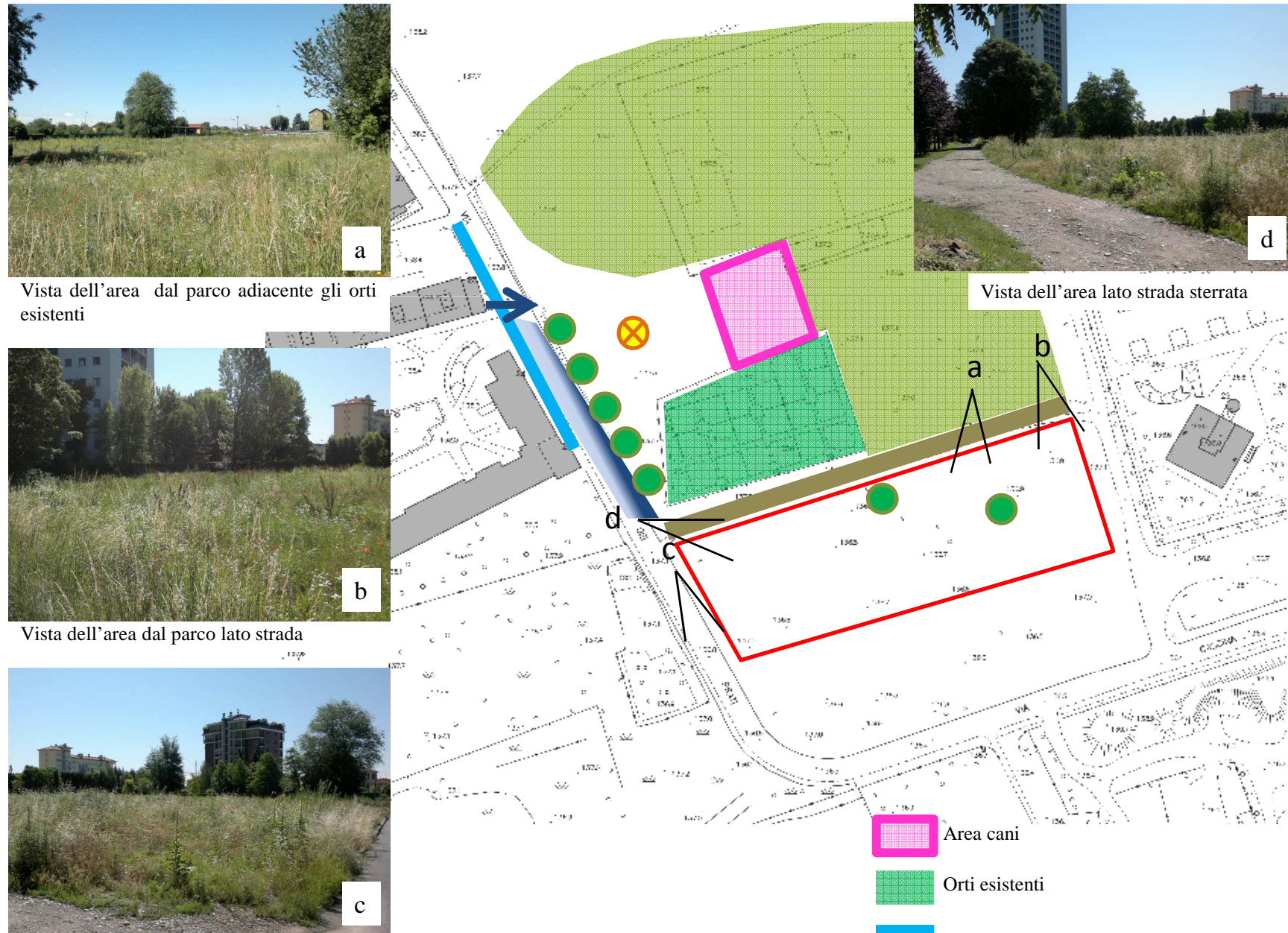
TAVOLA DELLO STATO DI FATTO