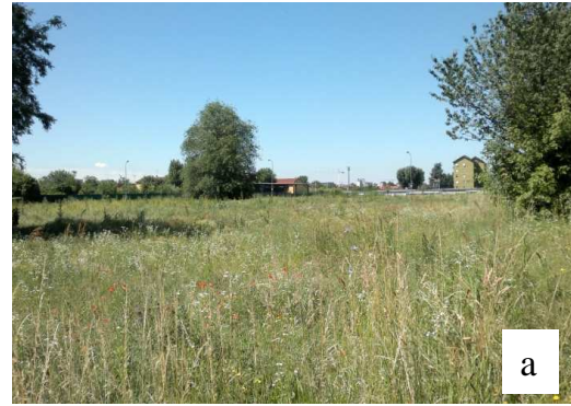
Vista dell'area dal parco adiacente gli orti esistenti